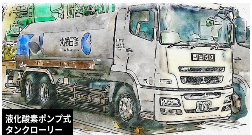
液化酸素ポンプ式 タンクローリー